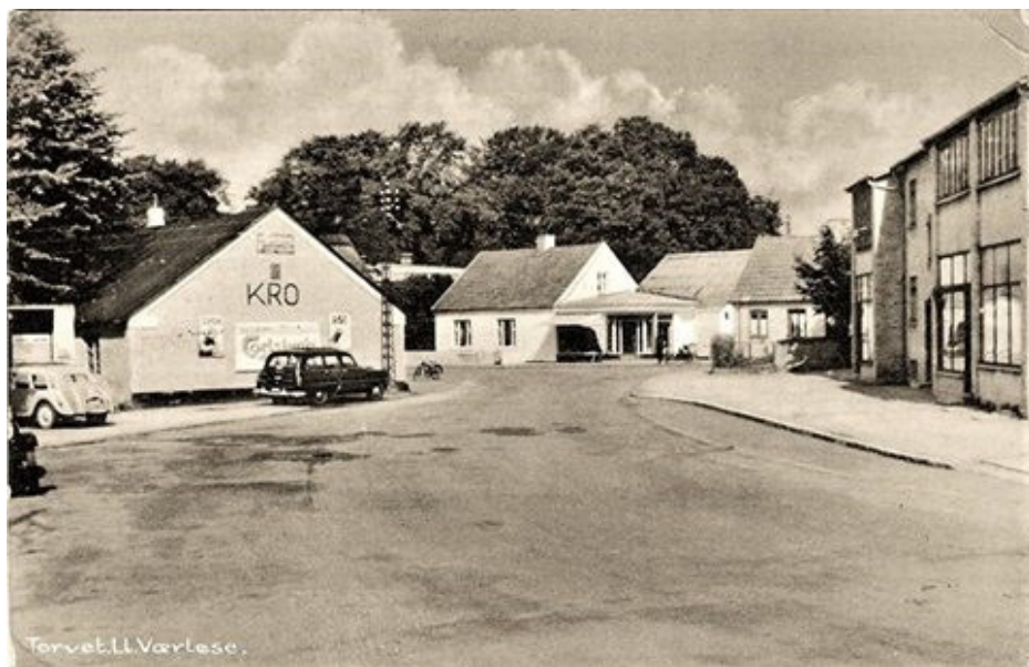
Kropladsen set fra Lille Værløsevej.