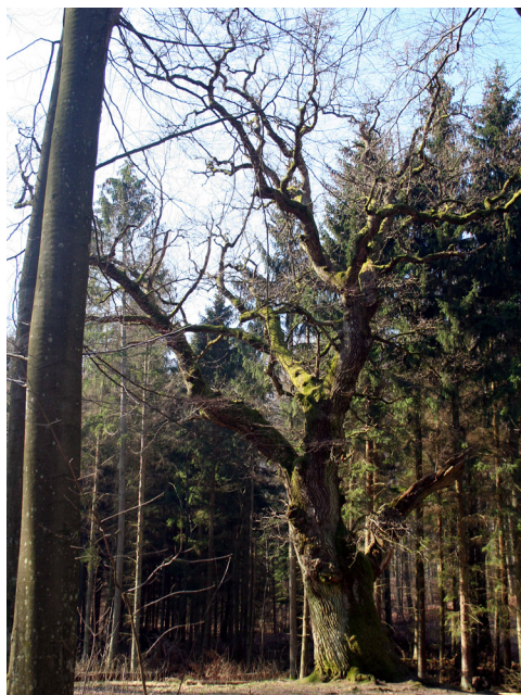
Grenaderen i Jonstrupvang.

Vi mødes på Skovlystvej på den parkeringsplads, der dukker op i svinget lige efter Gisselfeld-broen på vejen fra Bryggeriet Skovlyst og ud til Ballerupvej. Den kaldes også for den høje P-plads ved Gisselfeld-engen.