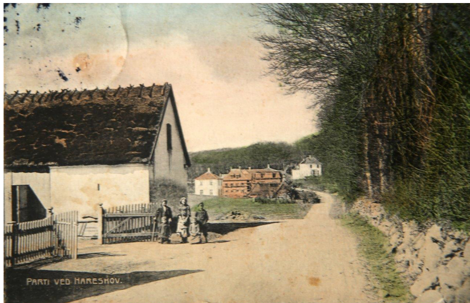
Gammel Hareskovvej med udsigt til nye villaer.