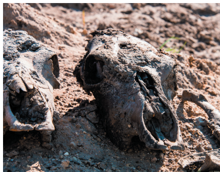
Ofrede hestekranier.

I jernalderen (ca. 500 f.Kr. -700 e.Kr.) var trosforestillingerne meget omfattende og kan være vanskelige for os at forstå i dag. Alligevel er der elementer, som minder meget om nogle elementer i den gamle folketro eller overtro, der eksisterede på landet især helt op i det 20. århundrede – er det en tilfældighed? Foredraget vil have en særlig nordsjællandsk vinkel på emnet, men sætte det i perspektiv med andre fund fra Danmark.