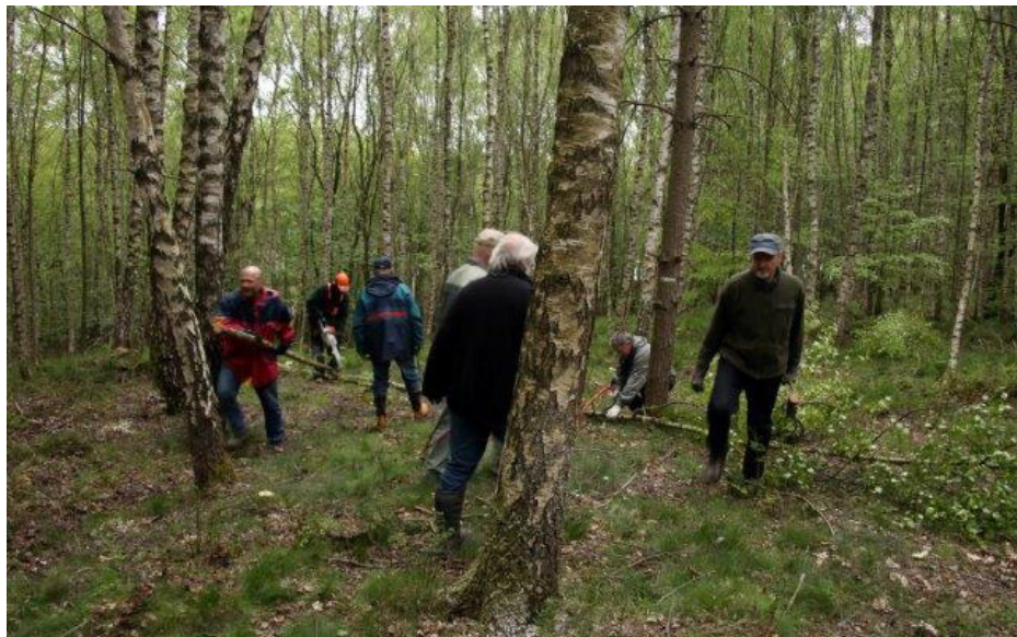
En tidligere skovrydning.

Mødested: på parkeringspladsen ved Fiskebækhus og Frederiksborgvejen.