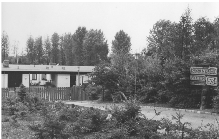
Vesterbo Børnehave og Byggelegeplads.