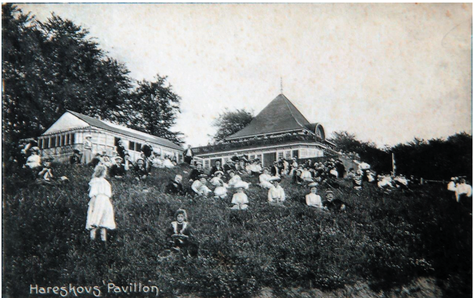
Sommerdag ved Hareskovpavillonen.