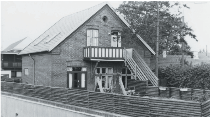
Børnehaven på Gadekærvej.

Af kommunale institutioner findes der 3 børnehaver med plads til 64 børn, 1 fritidshjem med plads til 50 og 1 ungdomsklub, der har åbent 3 aftner om ugen og er godkendt til 40 unge mellem 14 og 18 år.